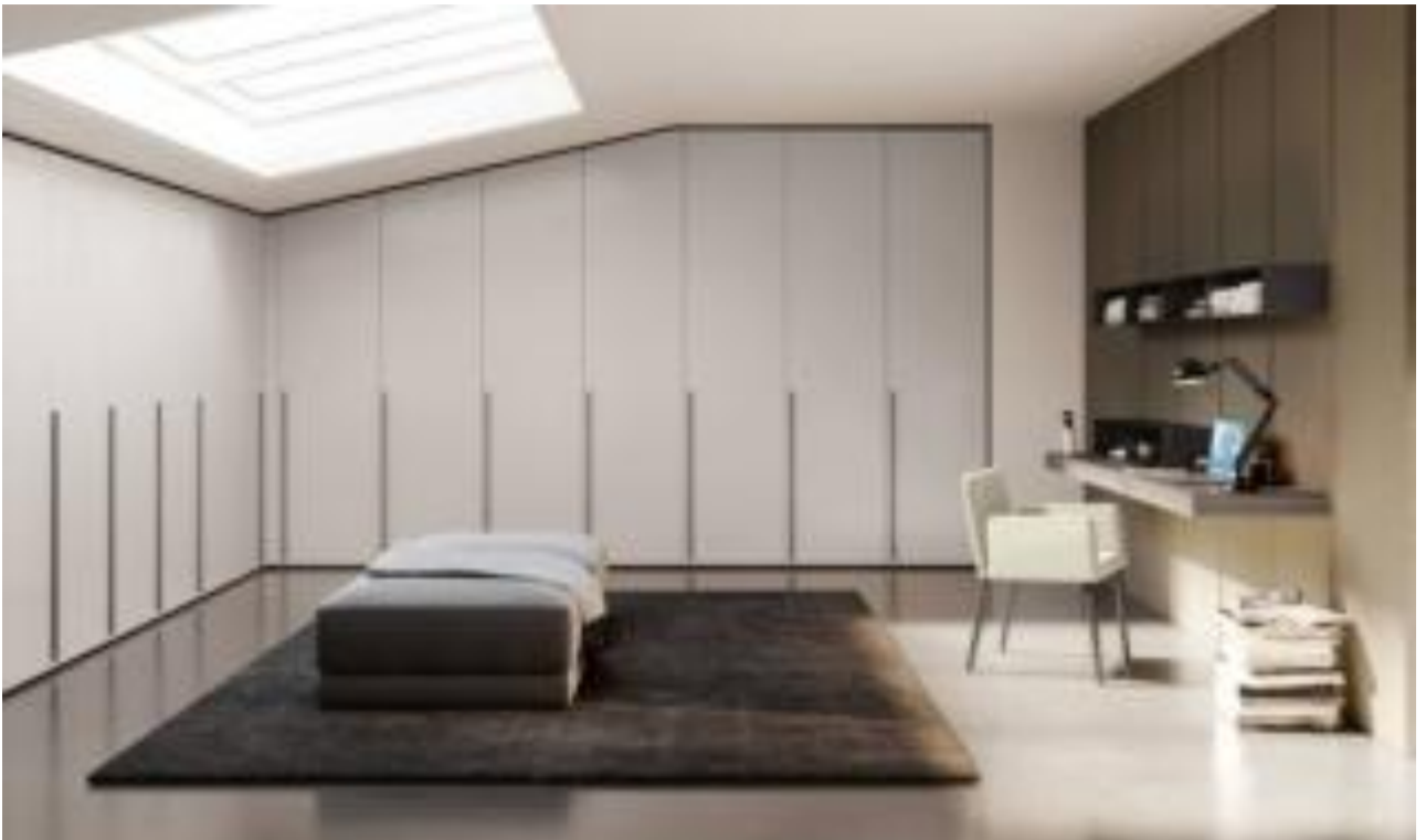
Barret di Febal Casa

Veste completamente l'angolo della mansarda il grande armadio con anta battente Barret di Febal Casa che ha le ante in nobilitato Grigio dorian e le maniglie in nobilitato Eucalipto argento che danno vita ad un elegante contrasto. Include anche una pratica postazione home working. É in grado di inserirsi in uno spazio dal soffitto variabile usando ante debordanti in altezza e con taglio mansardato. L'anta a battente Barret misura L 45 x P 2,5 x H 225,8 cm. Prezzo 356 euro. www.febalcasa.com