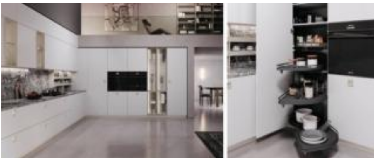
Ego di Febal Casa

Raffinata e senza tempo la cucina angolare Ego di Febal Casa ha le ante lisce laccate bianco, impreziosite dalle maniglie geometriche Segreto in metallo champagne opaco, che creano un piacevole contrasto con il top e lo schienale in marmo grey spazzolato. La colonna ad angolo è attrezzata con cestelli e comodi vassoi a meccanismo scorrevole. La composizione è scandita dalla presenza dei vani a giorno Segno in laccato opaco grigio seta. Un modulo base misura L 15 x P 57 x h 72 cm, prezzo a partire da 68 euro.