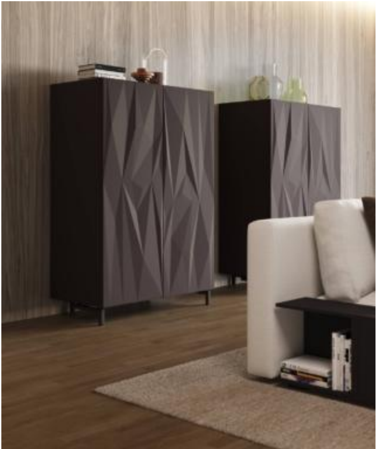
Madie alte della collezione Libeskind022 di Febal Casa

Sono sistemate in coppia lungo la parete del living le madie alte della collezione Libeskind022 di Febal Casa rese speciali dalla superficie tridimensionale delle due ante che crea suggestivi giochi di luce. Misurano L 101 x P 56 x H 154 cm. Prezzo a partire da 3.069 euro. www.febalcasa.com