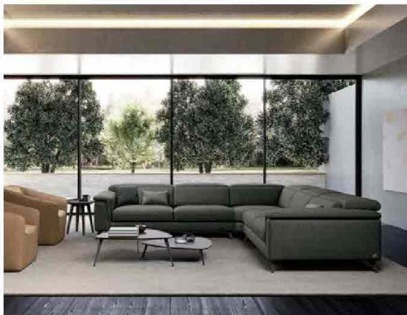
FEBAL Kensington, divano in tessuto con piedi in metallo