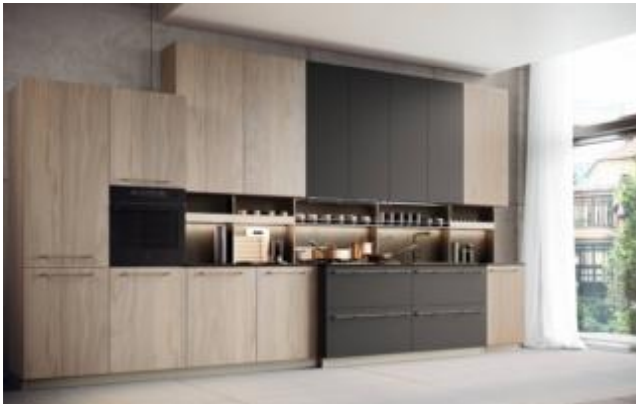
Over della Collezione Modula di Febal Casa

“Veste” la parete, dal pavimento al soffitto, la composizione Over della Collezione Modula di Febal Casa è realizzata con materiali eco-friendly: le ante, dotate di maniglie orizzontali Eclettica o di gole, sono realizzate in nobilitato legno noce beige e nobilitato grigio titanio. Le basi avanzate aumentano la superficie di lavoro; lo stile industrial chic la rende adatta ad ambienti contemporanei. Un modulo base da L 15 x P 57 x H 72 cm, prezzo a partire da 68 euro. www.febalcasa.com