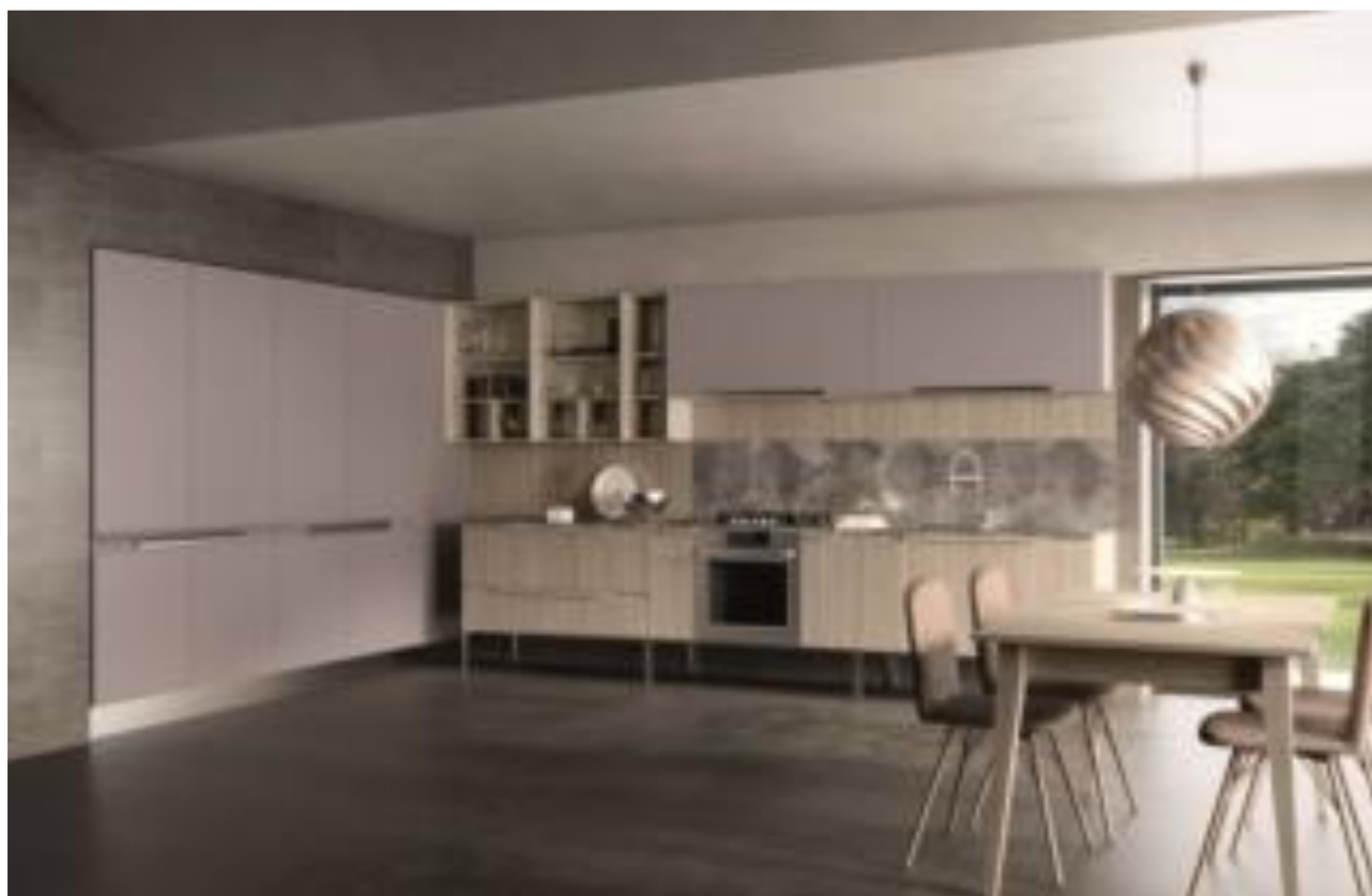
Chantal di Febal Casa

È caratterizzata da uno sviluppo lineare che veste anche l'angolo Chantal di Febal Casa, il modello con le ante effetto legno realizzate in Nobilitato Rovere Camargue che crea un piacevole contrasto con il piano di lavoro in laminato Cuma Dark. I pensili e le colonne sono in Laccato opaco Grigio platino, una delicata tonalità che illumina tutto l'ambiente. Un modulo base da 60 cm, prezzo 202 euro. www.febalcasa.com