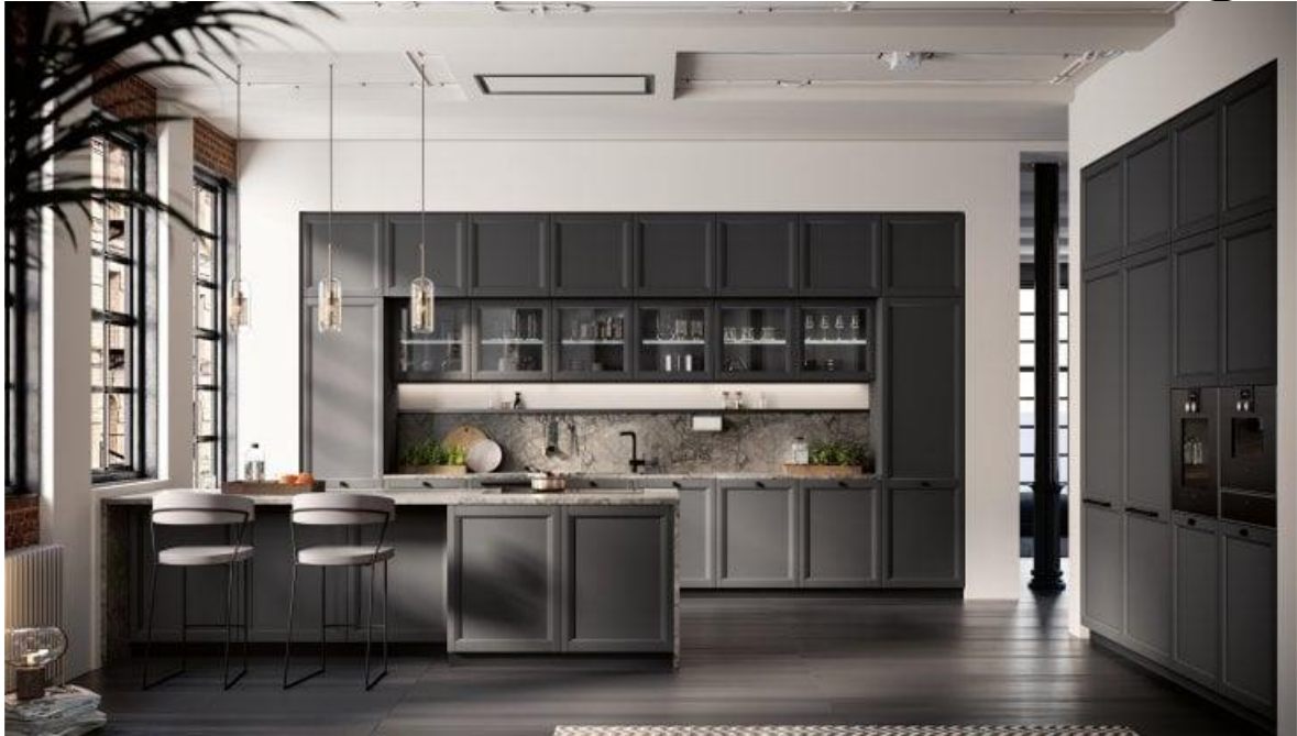
Una configurazione di Class, il nuovo sistema cucina di Febal